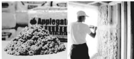
セルローズ断熱の材料

米国ミシガン州に本社を持つアップルゲート・インシュレーション社の半世紀に及ぶ経験と実績に裏付けられた断熱工法です。パルプ100%のアメリカの新聞紙（セルローズ）を断熱層として壁面に隙間なく吹き付け施工します。施工工程管理の品質の高さは、建築専門家の間でも高く評価されています。